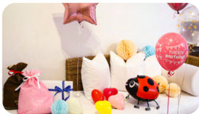
キッズアニバーサリープラン