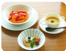
お子様料理 B ¥1100