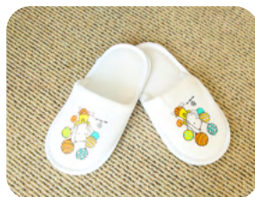
スリッパ 18 cm