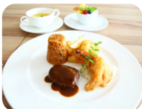
お子様料理 A ¥1650