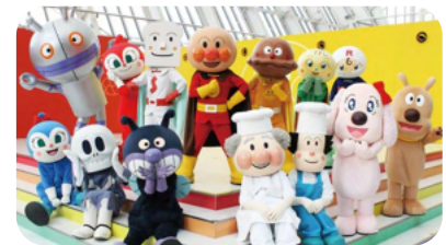
福岡アンパンマンこども ミュージアムチケット付