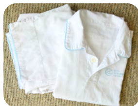
子ども用パジャマ サイズ 130